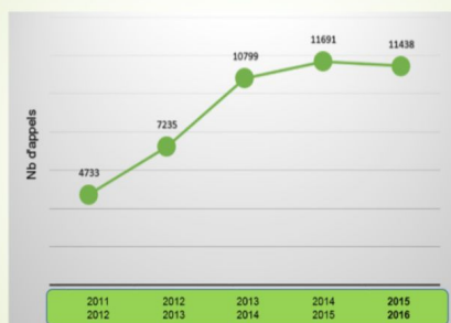
Évolution du nombre d'interventions téléphoniques au cours des 5 dernières années

Nous espérons être en mesure, au cours de la présente année, de maintenir la prestation de services en temps opportun pour tous.